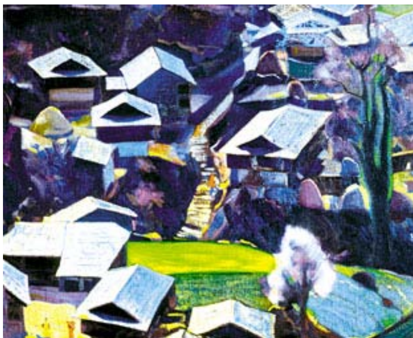
С.Н.Рерих. Долина Кулу Галерея Н.К.Рериха, Наггар