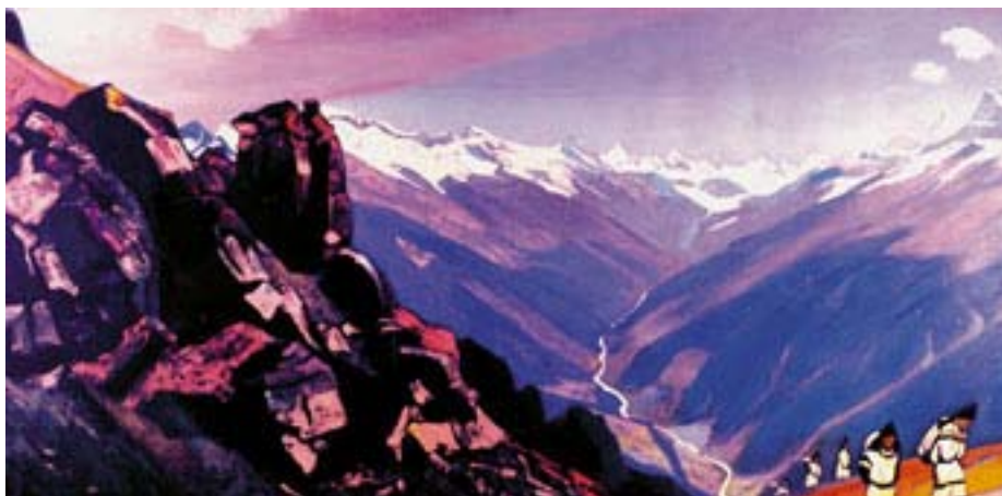
С.Н.Рерих. Долина Манали. 1934 Шри Читралайям галерея, Тривандрум