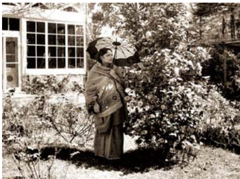
Девика Рани Рерих в Кулу