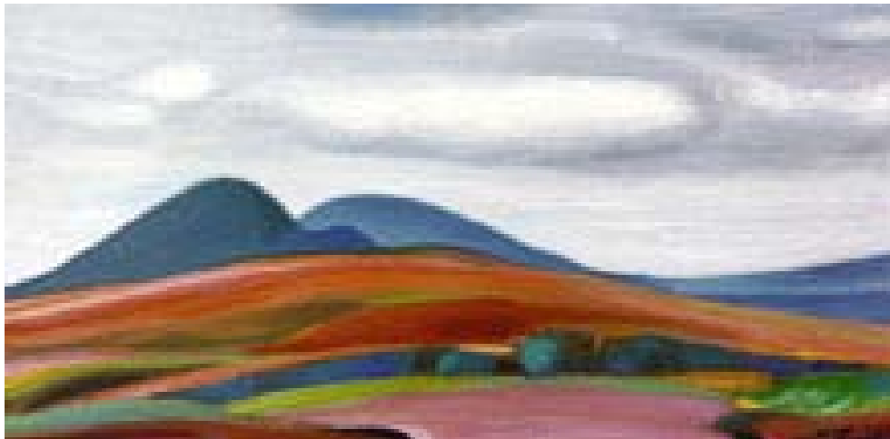
С.Н. Рерих. Красная земля. 1972

те контакт или получите что-то из тех сфер, куда вы устремляетесь».