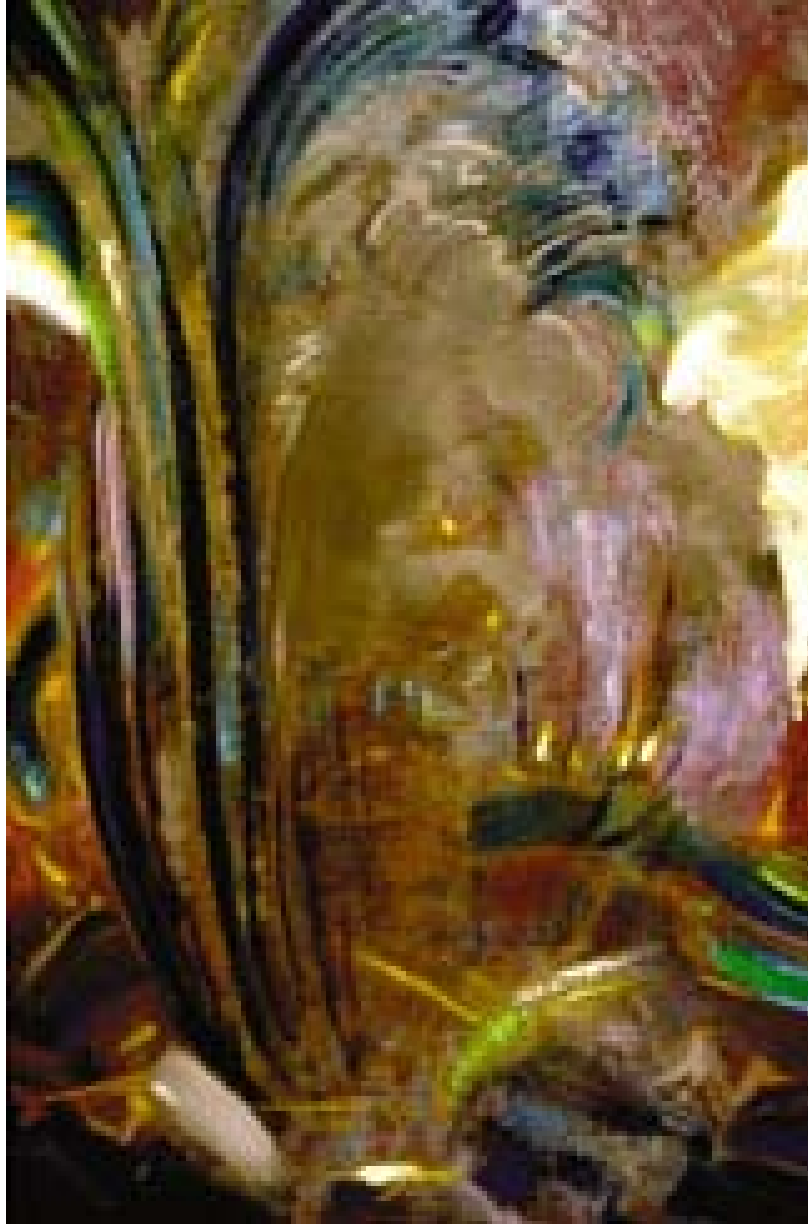
С.Н. Рерих. Весна. 1959